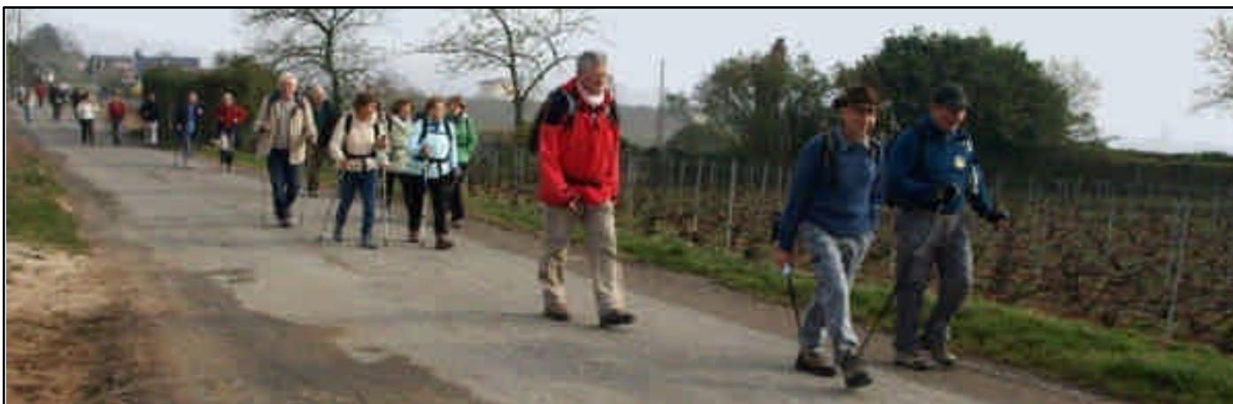
En route sur le parcours du « fil rouge » Reims-Troyes

A cette occasion, il sera remis à chaque pèlerin un petit souvenir. Il devrait s'agir d'un écusson carré de 7cm de côté rappelant que le bénéficiaire est un « Jacquet de RP 51 ». Nous faisons appel à vous pour nous proposer des modèles de dessin en les envoyant à : communication@randonneurs-pelerins.fr