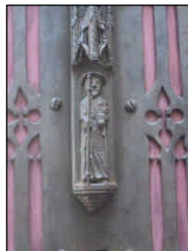
Le plus petit St Jacques de la capitale