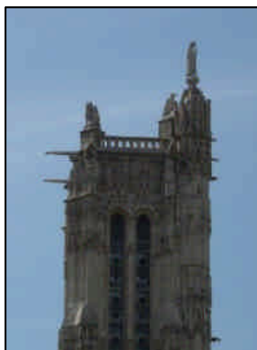
Saint Jacques du haut de sa tour