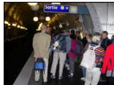
RP 51 dans le métro !

Ce fut une journée merveilleuse pour tous, dans une ambiance gaie et chaleureuse.