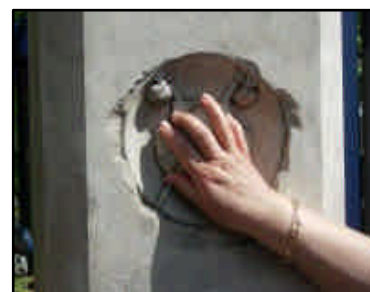
Un peu de bonheur ?