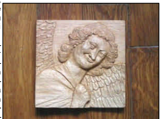
L'Ange au sourire - bas-relief de Gilbert C.